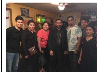
Algunos jóvenes de nuestra parroquia con el Sr. Obispo en Theology on Tap